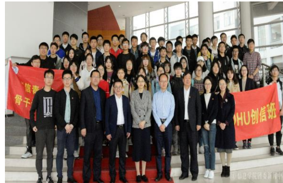
信息学院相关活动集体合照