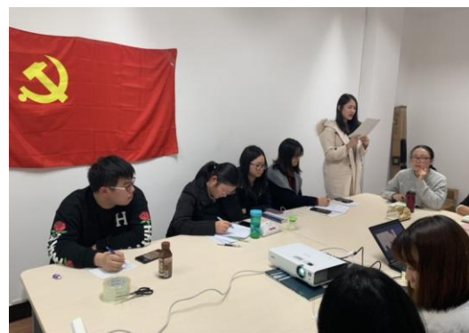
读经典革命文学 忆往昔峥嵘岁月

为庆祝新中国成立70周年，五四运动100周年，建党98周年，外语学院学生党员以党团活动平台为载体开展了系列主题教育活动，对学院传统的党建组织培养模式进行了有益补充和有效拓展。系列活动内容包括学生党员进社区、智力帮扶乡村学校、爱心捐书、师生共建读经典革命文学以及五四表彰暨“外语学院第一届传承者”遴选活动，在志愿服务、社会实践、学习典范、工作楷模四大领