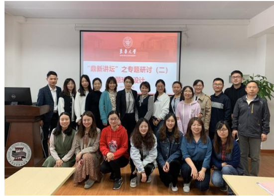
鼎新论坛与会人员合影