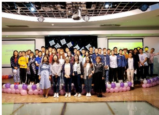
环境学院心理情景剧大赛集体合影