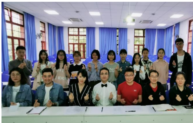
心理读书分享大赛选手与评委老师合影

5月14日,管理学院心理协会主办的首届“一期一书”心理读书分享大赛决赛圆满落幕。活动分为阅读理解、线上分享投票、线下分享三个阶段。最终评选出网络人气奖1名,一等奖1名,二等奖2名,三等奖3名。该活动旨在给学生分享好书,分享知识,提升学生的沟通能力,改善人际关系,促进心理健康。