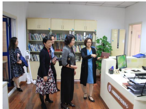
调研组参观心理健康教育与咨询中心