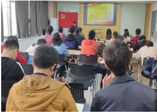
材料学院党委举行党建实务工作专题培训会