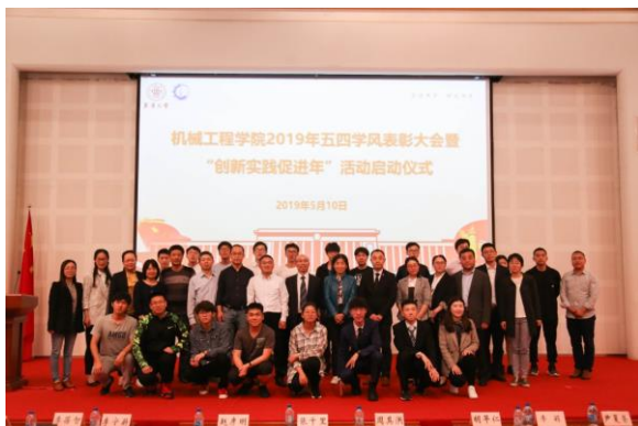
机械工程学院五四学风表彰大会