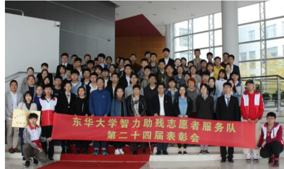
东华大学智力助残志愿者服务队表彰会